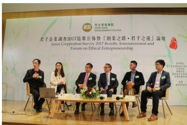
論壇嘉賓交流商德精神

香港2017年11月24日電 /美通社/ -- 素以積極弘揚商業道德的恒生管理學院（恒管）七年前引入中國儒家的「君子」概念，舉辦「君子企業調查」，以嚴謹與科學化的學術調研，衡量2017年整體香港的商業道德水平，評選出香港市民心目中符合商業道德價值的企業，及弘揚企業五德的理念。